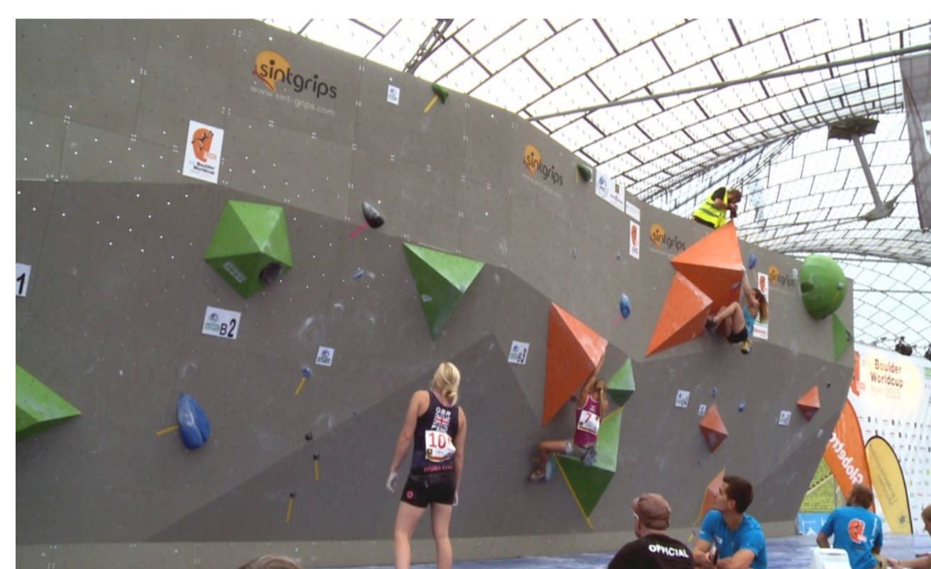
Abb. 1. Qualifikationsrunde beim Boulder Welt-Cup 2013 in München.

Im Wettkampfbouldern werden die Qualifikation und das Halbfinale im Intervallmodus durchgeführt, bei dem die Athleten die Boulder innerhalb einer vorbestimmten Reihenfolge und einem festgelegten Zeitintervall (Rotationszeit) klettern. Die Kletterzeit pro Boulder beträgt fünf Minuten und die Anzahl der Versuche, die ein Athlet pro Boulder durchführen darf, ist nicht vorgegeben. Zwischen den einzelnen Bouldern haben alle Wettkämpfer eine Ruhezeit von fünf Minuten. Zielsetzung dieser Studie ist die Untersuchung der Bedeutung der lokalen Muskelausdauer (LOM) im Wettkampfbouldern. Die LOM ist definiert als periphere Ermüdungswiderstandsfähigkeit der Unterarmflexoren bei isometrischer Muskelkontraktion mit wiederkehrenden Unterbrechungen während dem Weitergreifen zum nächsten Griff oder während Schüttelstellen, in denen eine ein- oder beidseitige Entlastung erfolgen kann.