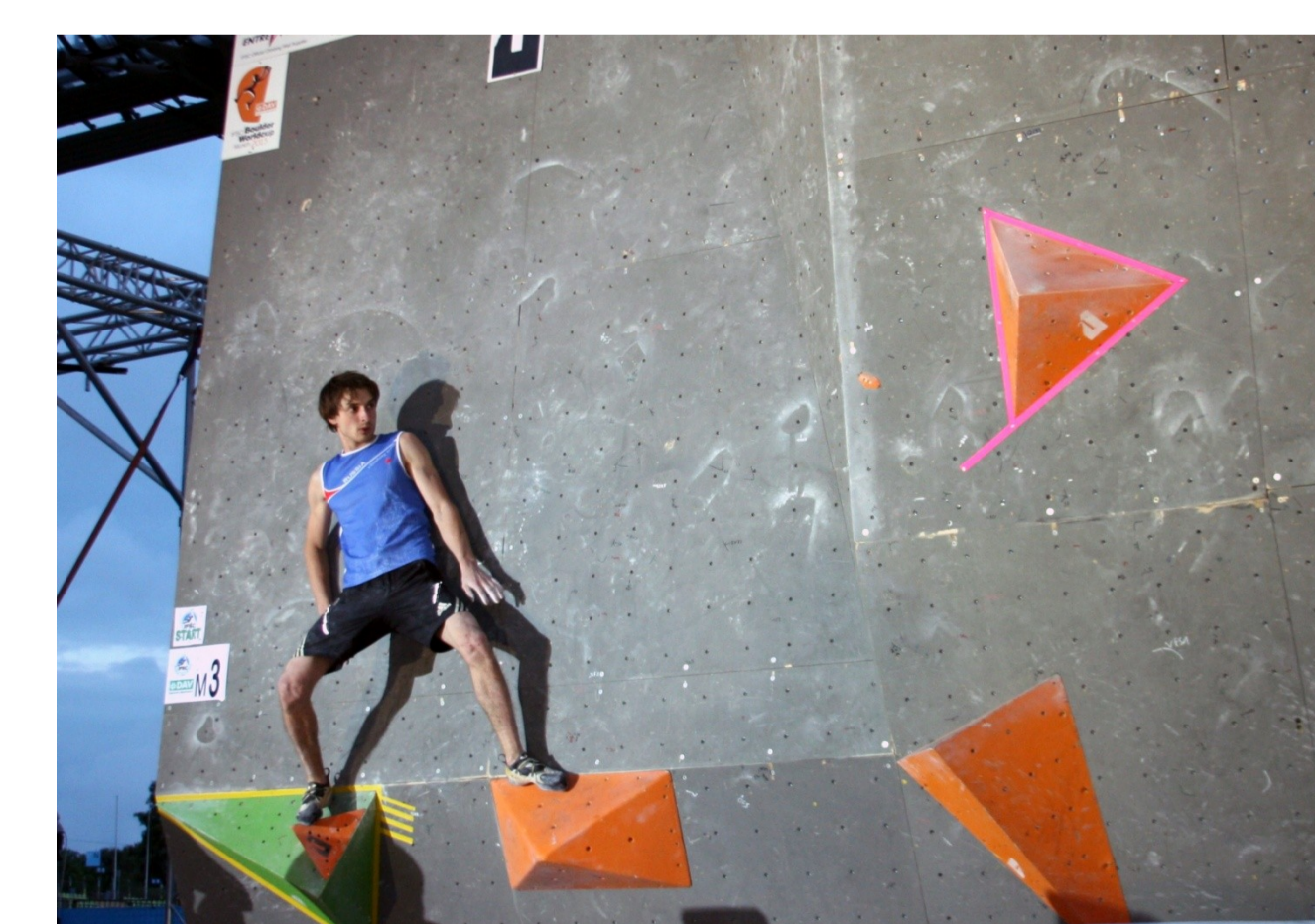
Abb. 3. Dmitry Sharafutdinov während dem Boulder Welt-Cup 2013 in München.

Die Frauen führten pro Boulder durchschnittlich einen Versuch mehr durch als die Männer (5 vs. 4). Überdies waren (a) die Versuchsdauer pro Boulder (15 s vs. 24 s), (b) die Dauer bei erfolgreicher Top-Begehung (34 s vs. 41 s) und (c) die Gesamtkletterzeit pro Boulder (64 s vs. 80 s) bei den Frauen niedriger als bei den Männern, während die Pausendauer zwischen den einzelnen Versuchen bei den Frauen (33 s) länger war als bei den Männern (27 s).